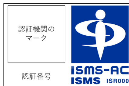
認証機関のマークと認定シンボルを並べて表示する場合の例

備考 2：認証のマークと認定シンボルを並べて表示する場合、両者が同一のマネジメントシステムに基づくものであることを示すために、両者を枠で囲むことが望ましい。