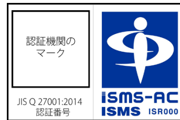
認証のマークと認定シンボルを並べて表示する場合の例

備考2：認証のマークと認定シンボルを並べて表示する場合、両者が同一のマネジメントシステムに基づくものであることを示す為に、両者を枠で囲むことが望ましい。